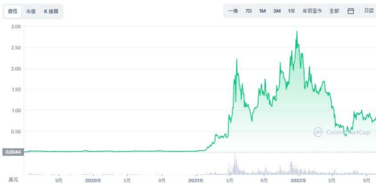
圖表：Polygon 到 USD

後來隨著加密市場復甦，MATIC 的價格也逐漸穩定在 1.3 美元左右，不過由於加密熊市和美股的影響，使得加密貨幣再度下修，MATIC 價格也下滑到 0.8 美元左右。