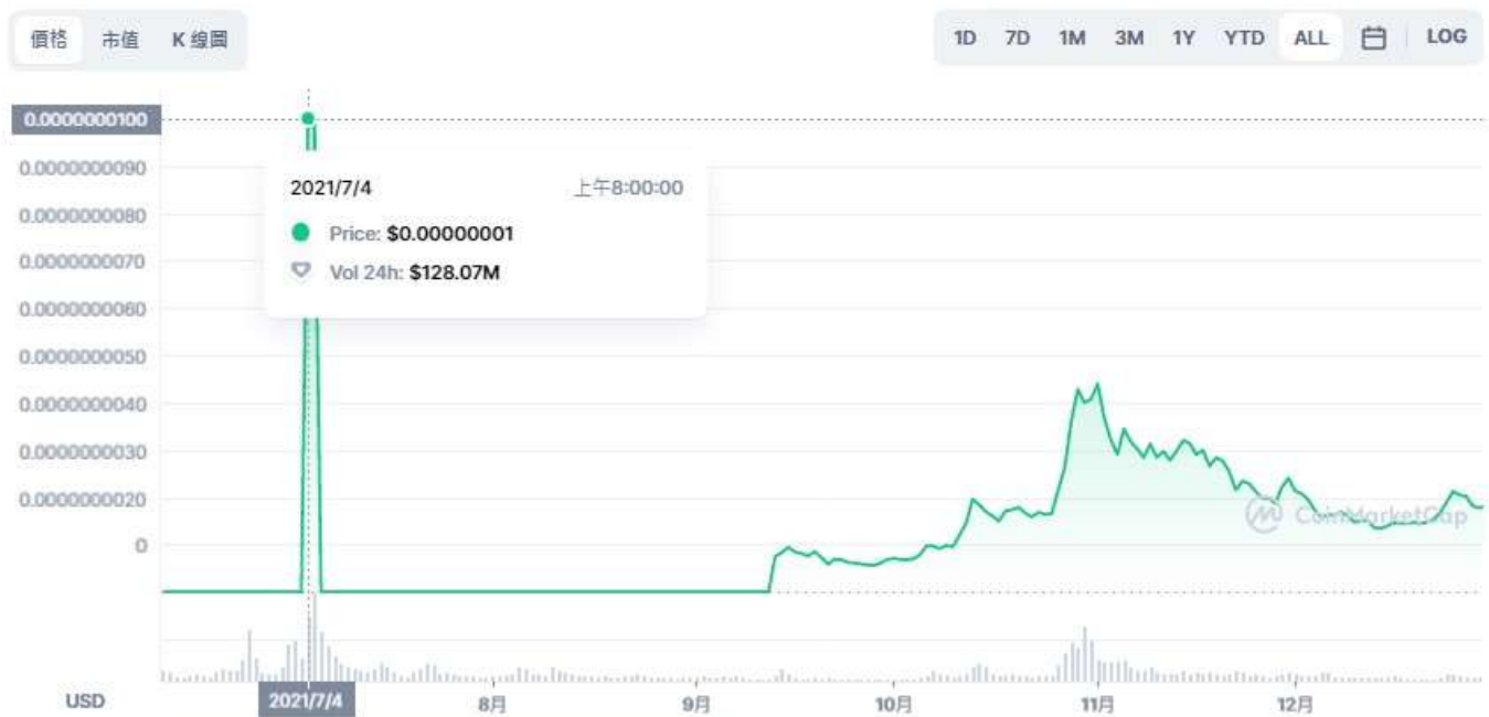
圖表：Baby Doge Coin 到 USD

在次期間，寶貝狗幣的價格水漲船高。在 7 月 4 號達到高點 0.00000007 美元，而後開始下跌，至 2021 年 9 月才開始有所上漲。