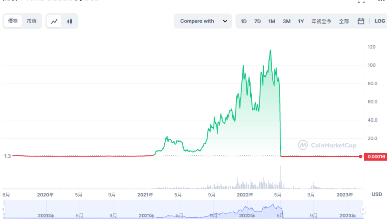
圖表：Terra Classic 到 USD

2023 年初，Terra 創辦人權道亨（Do Kwon）在南歐的度假勝地——「黑山共和國（Montenegro，又名蒙特內哥羅）」落網。受該消息衝擊，LUNC 幣在當日下跌逾3%，報1.36美元左右。