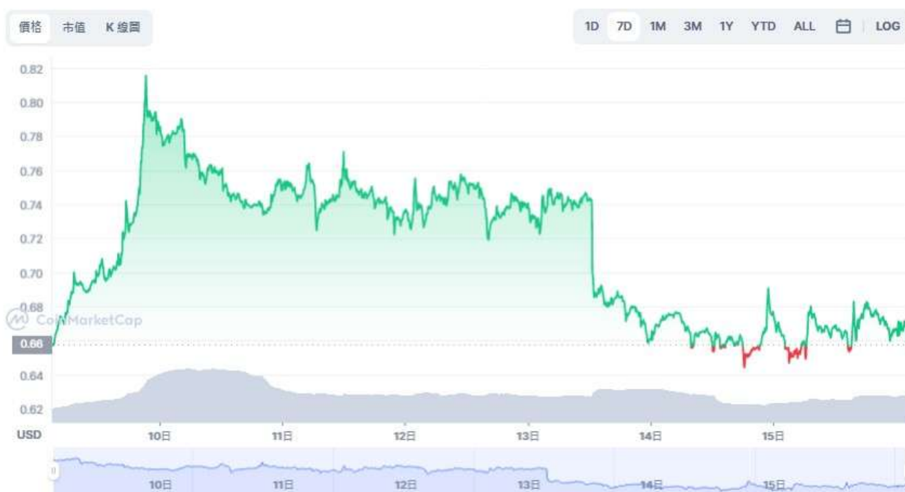
圖表：STEPN 到 USD

在撰寫本文時，GMT 報價 0.6655 美元，近 24 小時上漲 1.58%，其交易量也上漲 34.62% 至 149,496,535 美元。