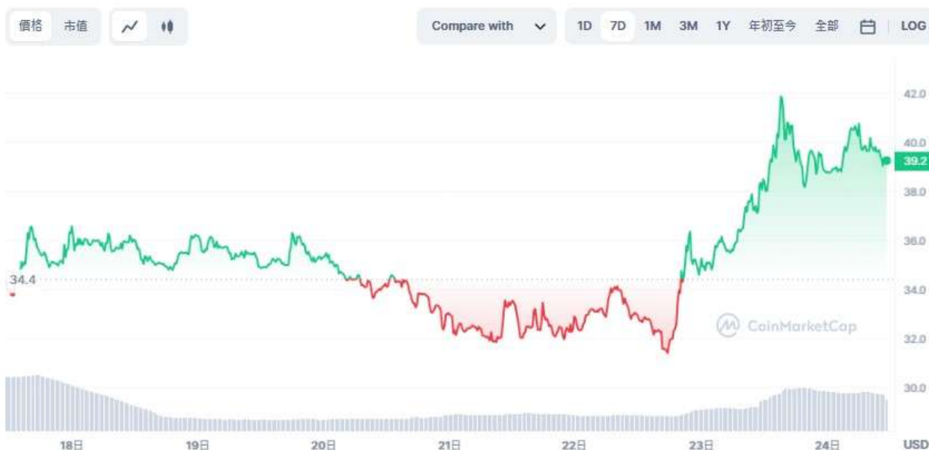
圖表：ssv.network 到 USD

據 coinmarketcap 數據顯示，去中心化以太坊質押基礎設施 SSV Network 的代幣 SSV 在 2/23 日大漲 28.91 % 至 40.59 美元，相較於今年 1 月初時仍在 10 美元附近，迄今漲幅超過 300%。