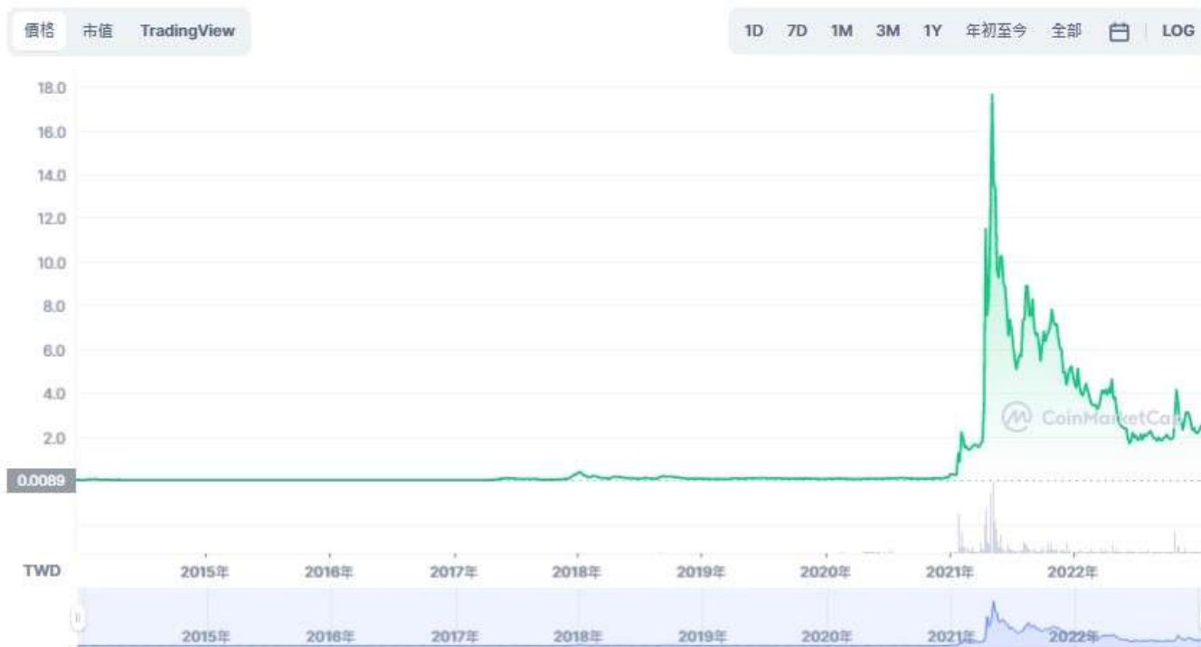
圖表：Dogecoin 到 TWD

事實上，狗狗幣的發行量大、易挖掘的特性，使得發行初期價格一直不高；也在2017-18年的虛擬貨幣泡沫（Crypto bubble）期間上沖下跌，狗狗幣在當時鼎盛時期最高的交易價格達到0.018美元，市值超過20億美元。