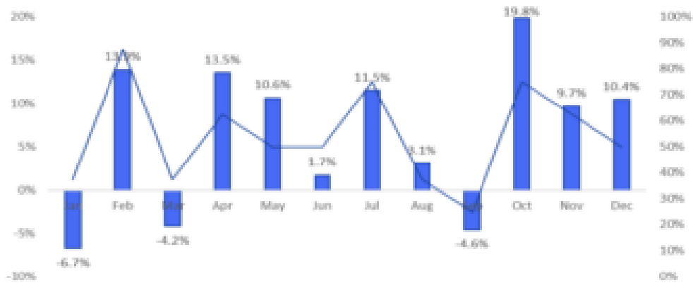
Exhibit 4: Bitcoin seasonality, avg. returns per month (LHS) vs. percentage of months positive (RHS)

此外，对 2023 年底的预期也仍然非常乐观，因为 Thielen 还认为比特币未来价格可能升至 45,000 美元。Thielen 表示，「比特币往往会上涨 10,000 点，然后回撤 5,000 点，然后再上涨 10,000 点（直到年底达到 45,000 美元）。」