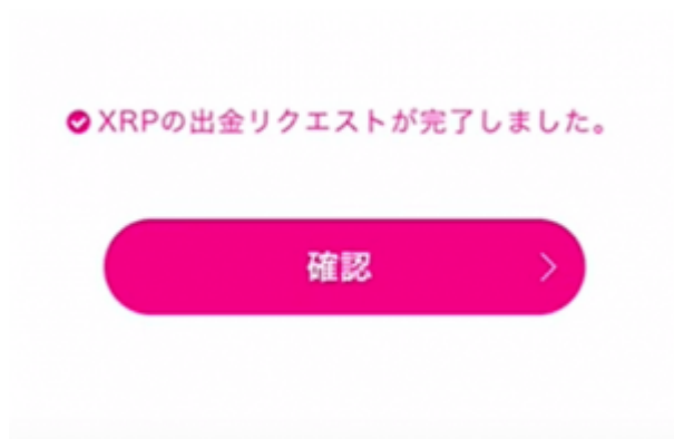
出金リクエスト完了確認画面

2段階認証を完了したら出金完了です！ トップ画面で出金のプロセスを確認することができます。